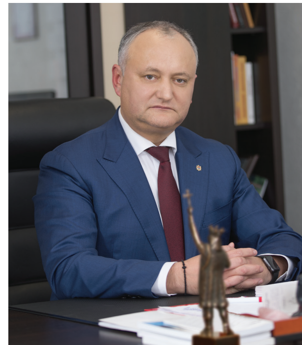
Igor DODON, Președintele Republicii Moldova

M Ü N C H E N , F E B R U A R I E 2 0 1 9